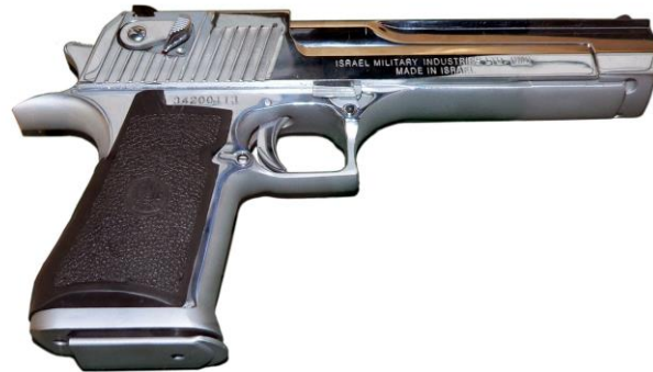
Figura 10 : Desert Eagle