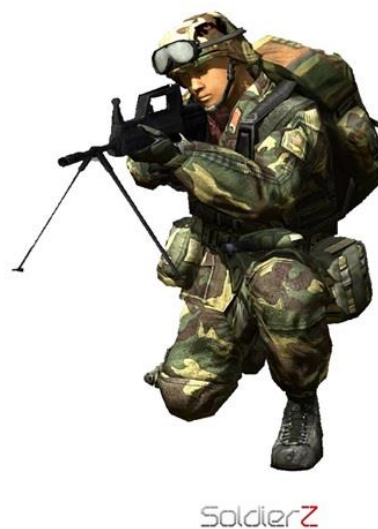
Figura 4: Menu Opções

AUDIO MUSICA ON OFF SONS ON OFF IMAGEM RESOLUCAO 1280 X 1024 CONTROLES TECLADO JOYPAD VOLTAR