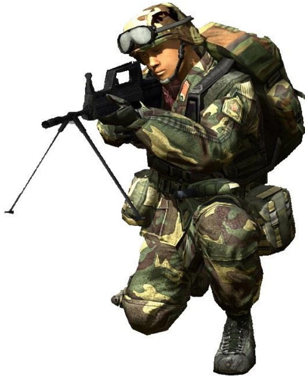
Figura 6: O Player