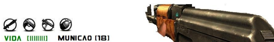
Figura 1: Interface básica de jogo

Visão em primeira pessoa, do personagem.