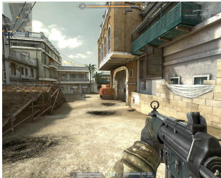
Figura 9: Cenário de Jogo. (Alliance of Valiant Arms - AERIA Games)

O Jogador inicia em um campo de treinamento, onde deve praticar tiro, cobertura, arremesso de granadas, arrombamento de portas e infiltração. Seguindo com sucesso no treinamento, o jogador parte rumo a sua primeira missão de resgate de reféns, em uma cidade tomada pelo terrorismo.