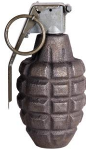
Figura 14 : Granada Explisova