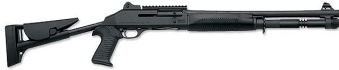
Figura 16 : Benelli M4