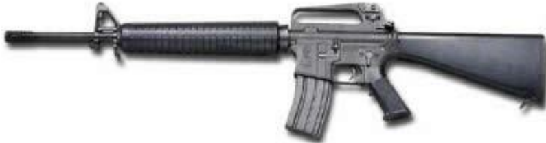
Figura 11 : M16