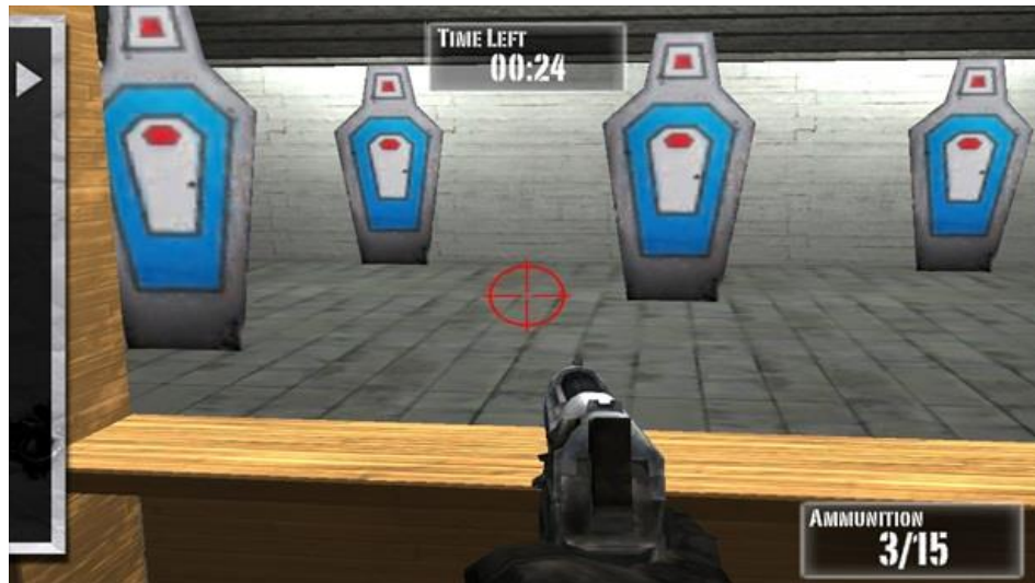
Figura 8: Cenário de Jogo. (NRA Practice Range - MEDL MOBILE, 2012)