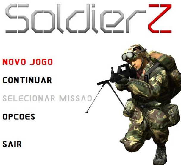
Figura 2: Menu Principal

As opções disponíveis no menu principal são as seguintes: