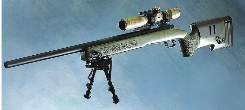
Figura 13 : M40