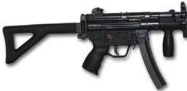
Figura 12 : MP5