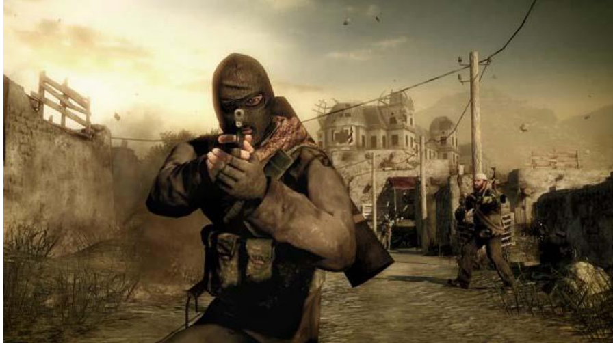
Figura 7: Terroristas