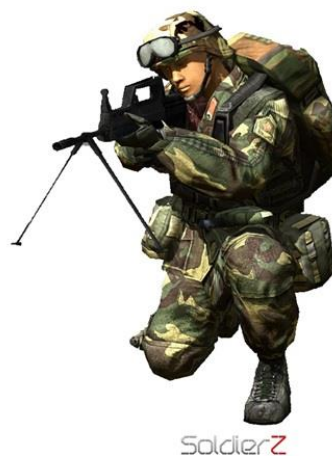
Figura 3: Menu Selecionar Missão

MISSAO #1 MISSAO #2 MISSAO #3 MISSAO #4 MISSAO #5 MISSAO #6 VOLTAR